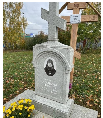
Светлая память отцу Зосиме!

Соловки свечи своего производства. Он мечтал окончить жизнь свою на Соловках, но Господь судил иначе. В 52 года игумен Зосима скончался от последствий коронавируса.